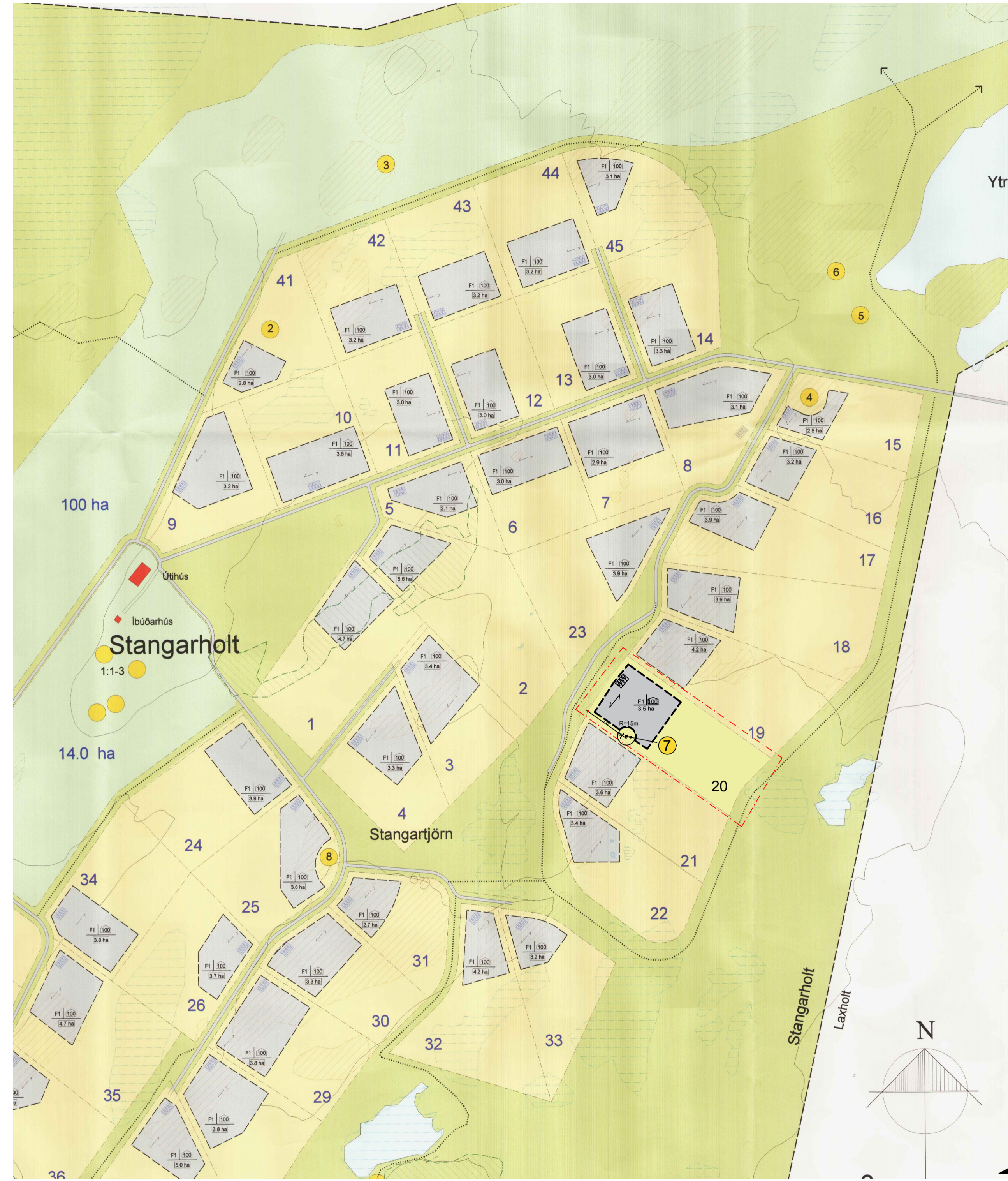
TILLAGA AÐ DEILISKIPULAGSBREYTINGU MKV. 1:5000