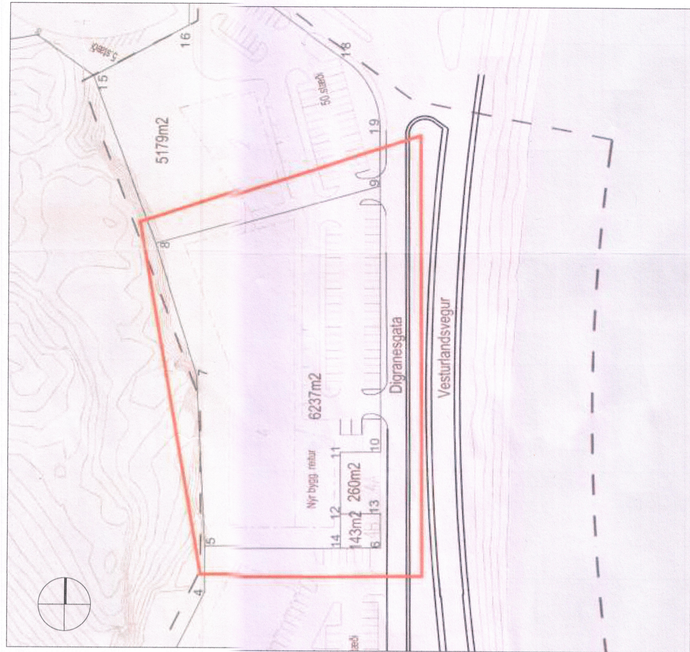
HLUTI GILDANDI DEILISKIPULAGS 1:1000