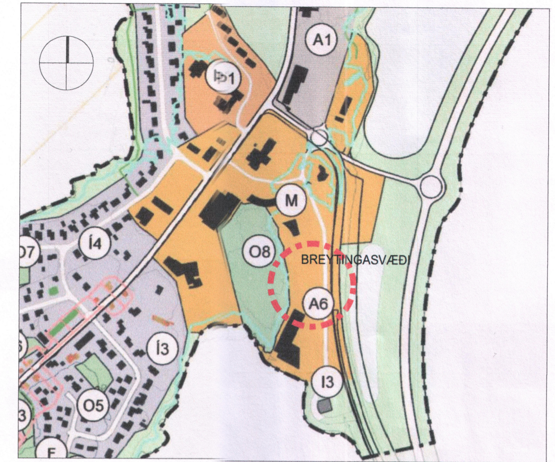
HLUTI GILDANDI AÐALSKIPULAGS 2010-2022