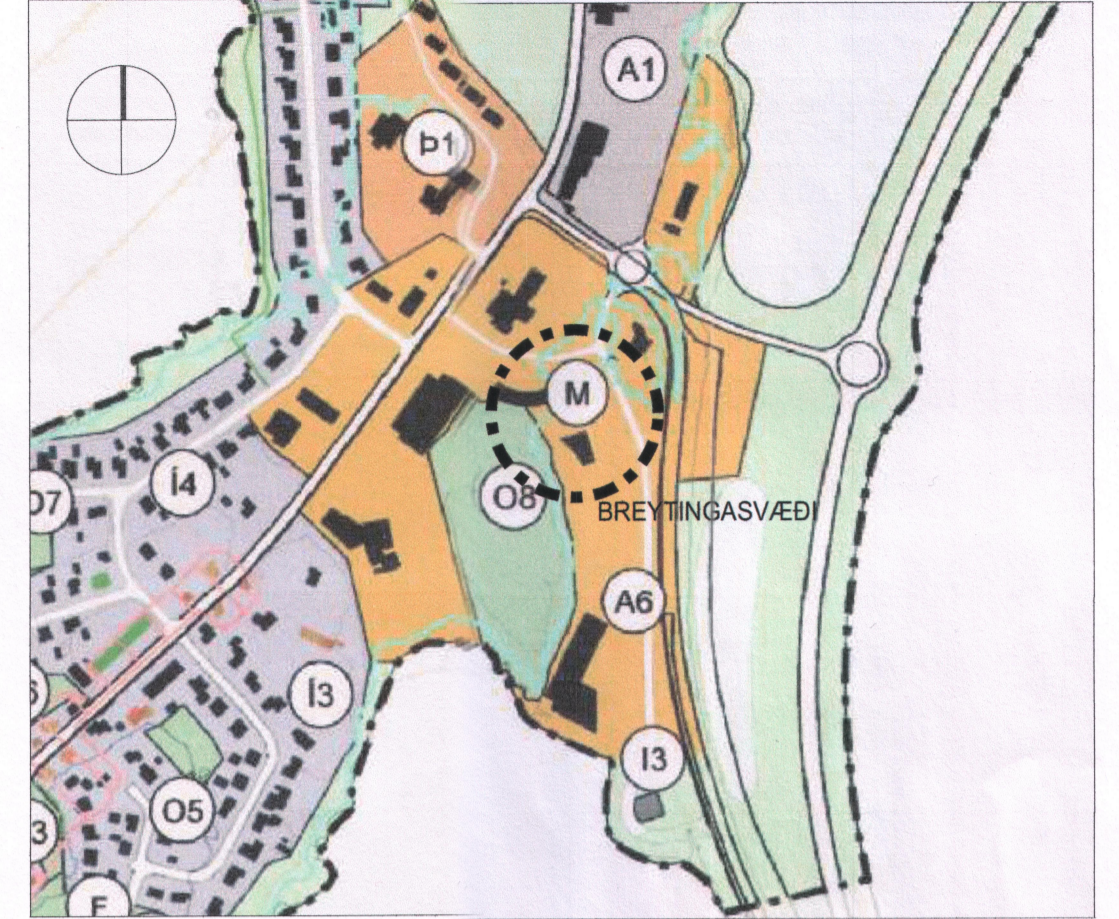
HLUTI GILDANDI ADALSKIPULAGS 2010-2022