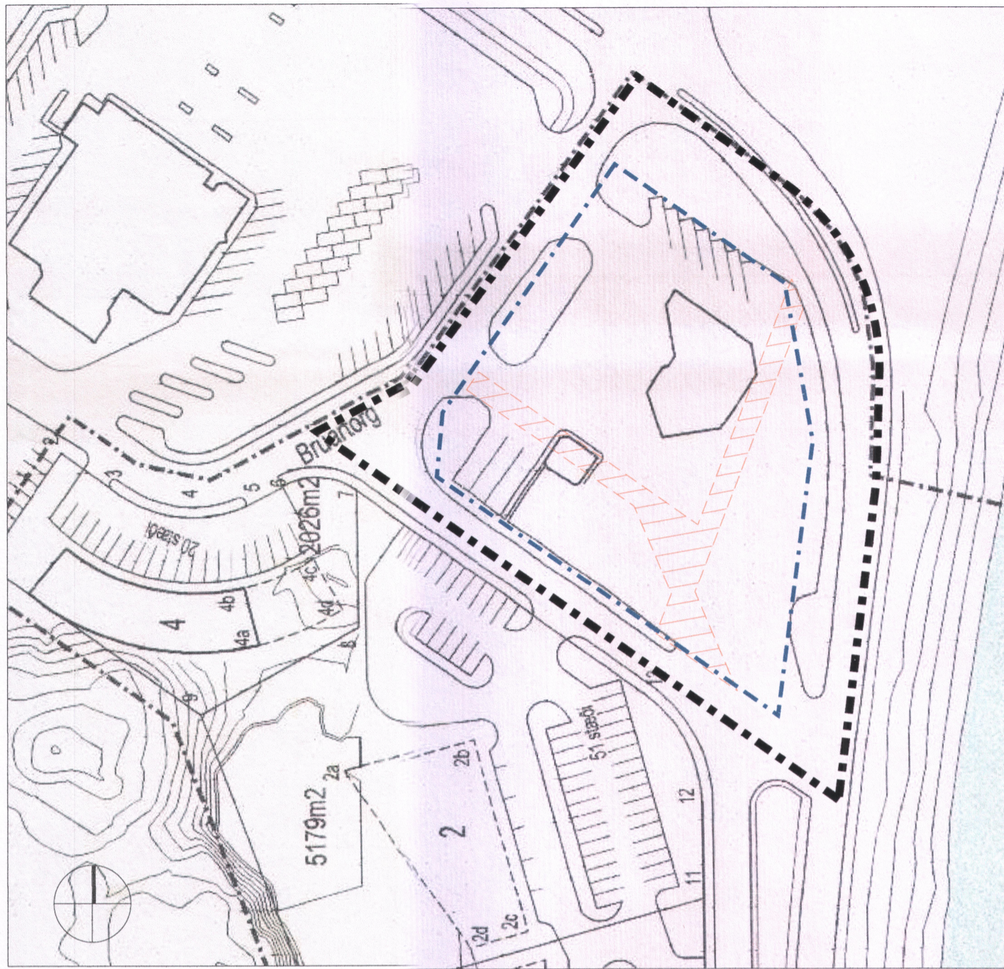
HLUTI GILDANDI DEILISKIPULAGS 1:1000