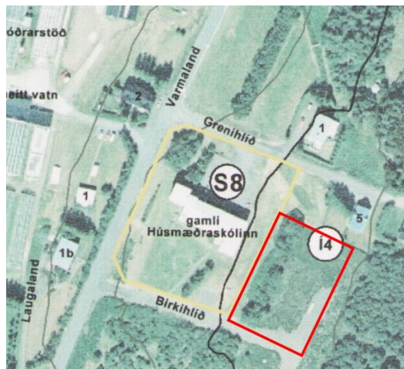
Mynd 2 - Afmörkun áætlaðs breytingarsvæðis sýnd með rauðum kassa. Á þessu svæði er gert ráð fyrir 2 lóðum í gildandi deiliskipulagi.

Í gildi er deiliskipulag fyrir svæðið frá 2005 þar sem gert er ráð fyrir 11 einbýlishúsalóðum. Deiliskipulaginu var m.a. breytt 2017 þegar hótelsvæðinu (gamli Húsmæðraskólinn) var bætt við deiliskipulag íbúðarsvæðisins.