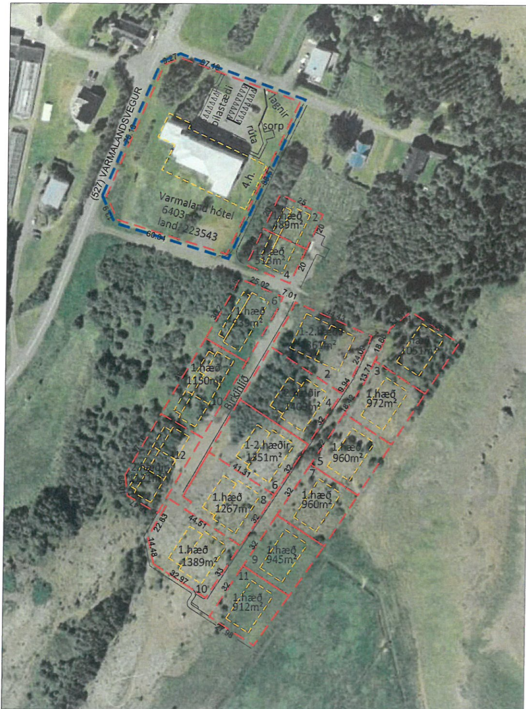
Gildandi deiliskipulag 1:2000