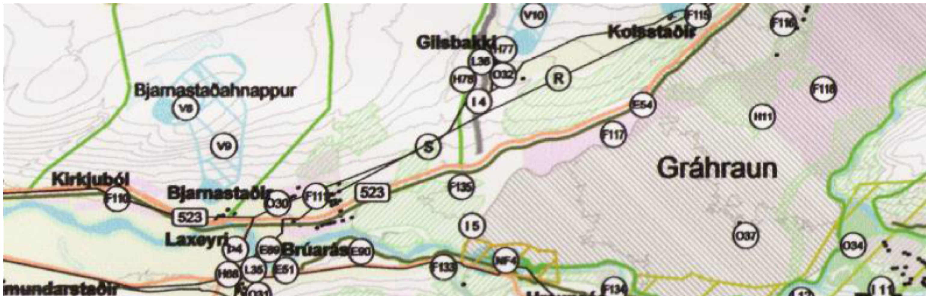
Hluti úr aðalskipulagi Borgarbyggðar, um 1:25.000