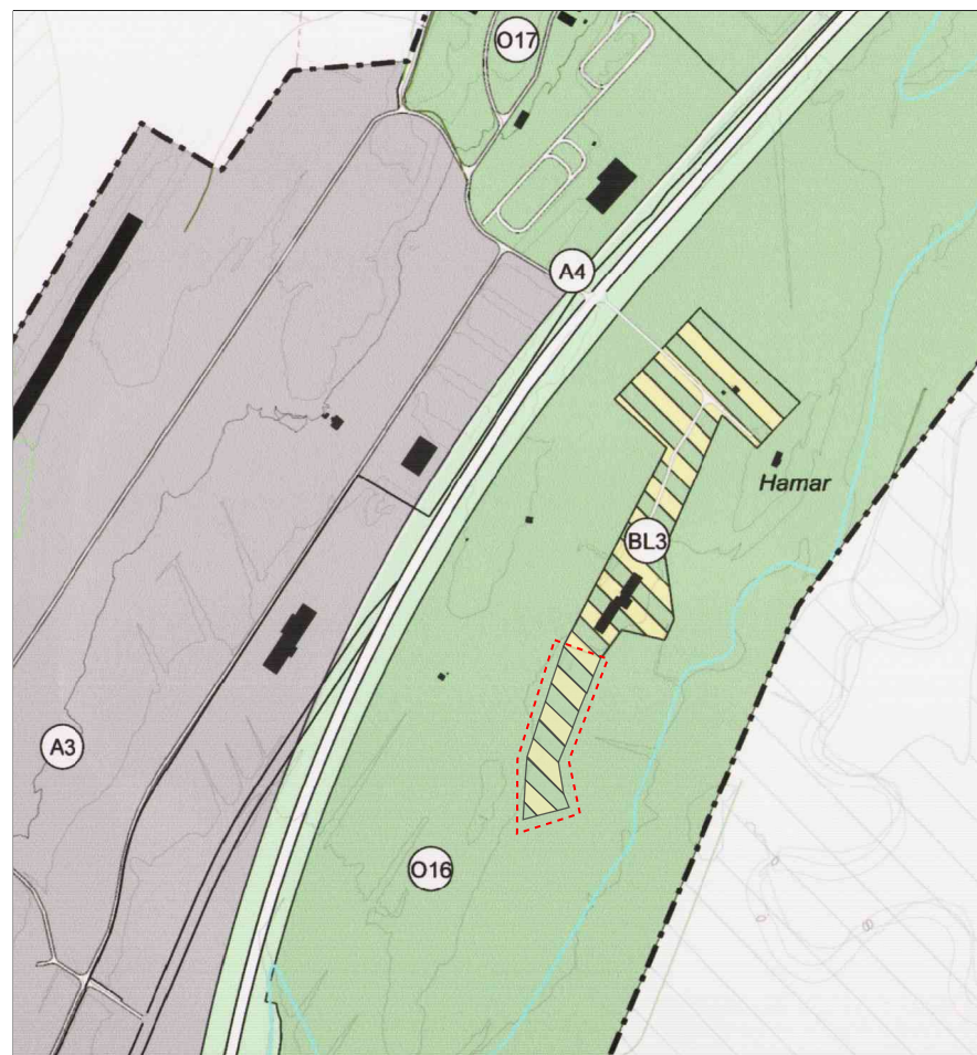
Hluti þéttbýlisuppráttar Borgarness eftir breytingu 1:10000