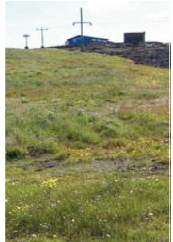
Myndir úr Bláfjallabrekkum fyrir og eftir notkun moltu, t.v. 2004 og t.h. 2006