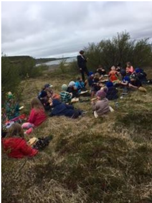
Vorferð í Hafnarskóg